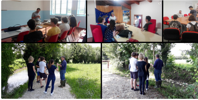
( http://www.cirf.org/wp-content/uploads/2018/09/2_LifeRisorgive.png )

Gli studenti sono stati coinvolti nuovamente nelle giornate di giovedì 14 e venerdì 15 giugno 2018, per l'esecuzione del campionamento in loco e la raccolta di nuove interviste e testimonianze.