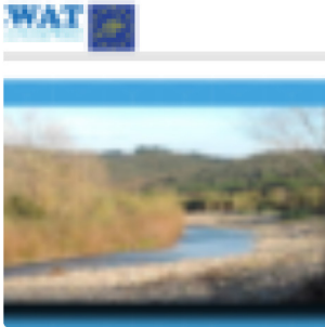
( http://www.cirf.org/it/rewat-international-workshop/ )

PRIMO WORKSHOP INTERNAZIONALE DEL PROGETTO LIFE REWAT ( HTTP://WWW.CIRF.ORG/IT/REWAT-INTERNATIONAL-WORKSHOP/ )