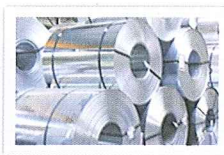
Taglio per l'industria

CAMU dal 1978 COIL PROCESS PRODUCTS IMPIANTI LAVORAZIONE LAMIERA