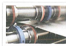
Taglio per l'attorney

Progettiamo e costruiamo linee slitter e per il taglio a misura di fogli da pochi decimi fino ai grossi spessori, oltre a macchine speciali per specifiche esigenze.